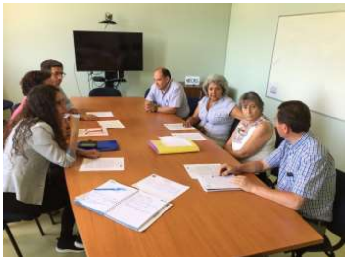
Representantes de la Universidad de Chile, Fundación “Puente Alto Puede Más” en la reunión de firma de convenio en el CRS.